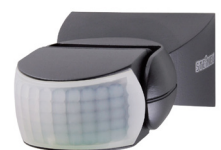
IS 1 svart